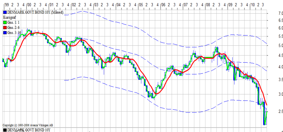
Figur 2: DKK 10 års renten

I nedenstående figur 2 vises den danske 10 års rente. Den var omkring 3,5% i februar 2010, hvor vi forventede fortsat faldende lang rente. Det har i den grad holdt stik, de første måneder faldt renten stille og roligt for så i maj og august 2010 at falde ret kraftigt til 2,2% p.t. I september er renten steget lidt igen til omkring 2,5 % på 10 års renten.